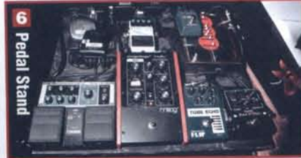
5 Pedal Stand

▲ボード外にも——[左から]アーニーボールの"6185" (ワウ・ペダル)、Majik Boxの"Body Blow" (オーヴァードライブ)、Line 6の"DL4" (ディレイ・モデラー)、MXRの"micro amp" (ブースター)が。これらはかなりの頻度で使用されるため、操作しやすいようにボード外に出されているものと思われる。